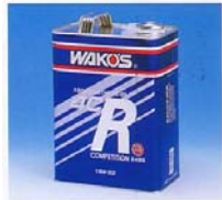
4CR フォーシーアール ☆100%化学合成油