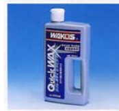
QW クイックワックス ☆汚れ落とし兼用ワックス