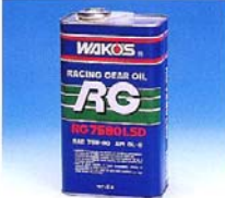
RG7590LSD アールジ-7590 ☆半化学合成ギヤオイル