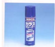
GLC ガラスクリーナー ☆溶剤ガラスクリーナー