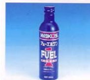
F-1 フューエルワッシュ ☆燃料系洗浄剤