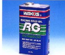
RG5120LSD アールジ-5120 ☆ワイドレンジギヤオイル